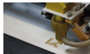
写真6：吉辰商店にてハンドルにカルテックの「K」ロゴをレーザーで1つ1つ加工