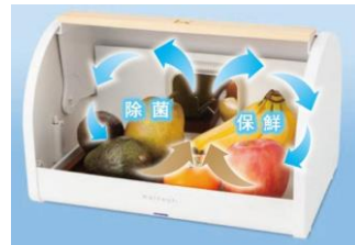
写真2：光触媒フィルターによる庫内の空気の流れ

※試験空間でのデータであり、実使用空間での検証はしていません。 評価空間：30リットルBOX 測定：ガステック製VOCモニター 初期濃度：5ppm