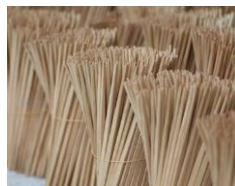
写真4：割り箸を製造