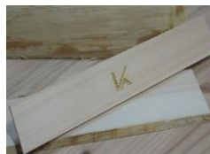
写真5：ハンドルに活用