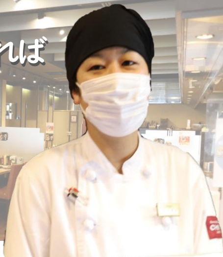
TABLE AIR CASE 01