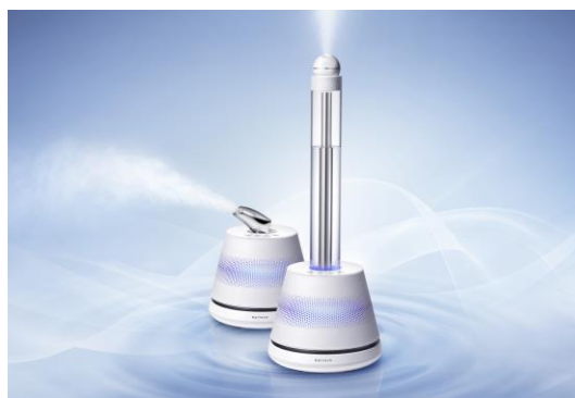
世界初※1 光触媒搭載 美容加湿器 KL-H01U