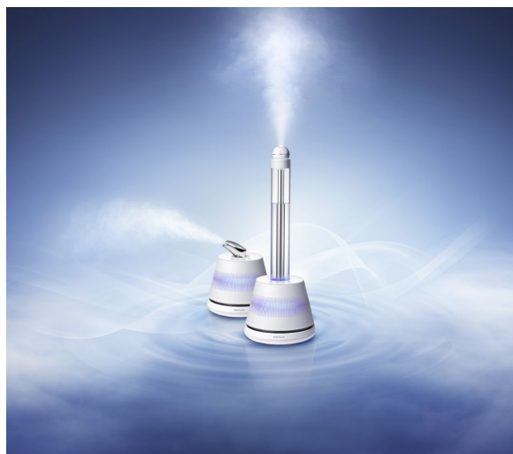
写真1 Youragi 潤水 プルミエール