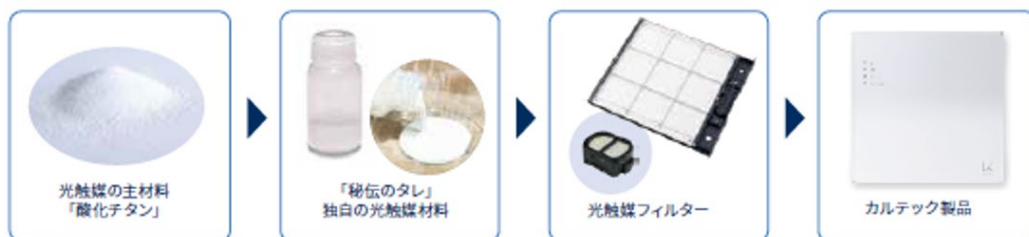
図2 材料から製品まで一気通貫で開発

カルテックの光触媒は業界最高水準の性能を実現しています。なかでも光触媒材料は唯一無二の「秘伝のタレ」。この光触媒材料に独自の工夫を施すことで高性能でかつ耐久性に優れた光触媒を実現し、世の中になかった製品を数多く創出しています。