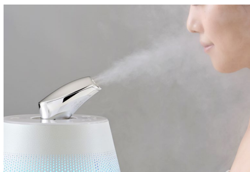
ビューティアタッチメント装着時