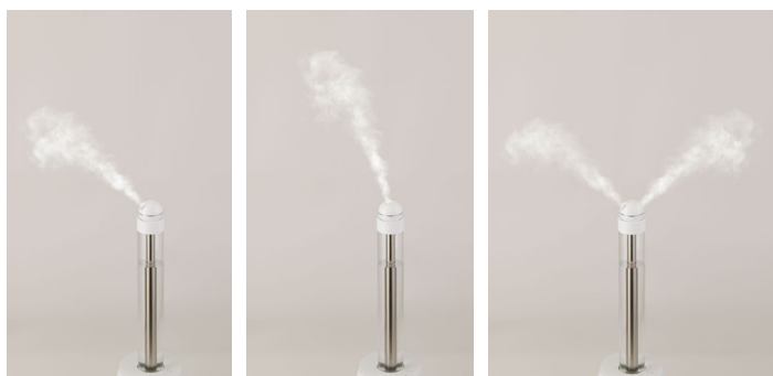
スマートヘッド装着時