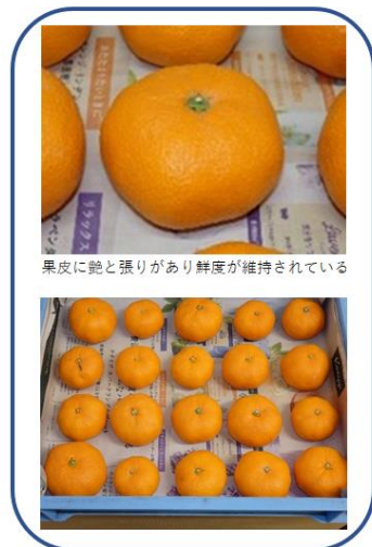
通常空間の鮮度試験(腐敗果10/40個)