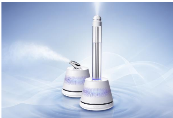
<光触媒搭載 美容加湿器 KL-H01>