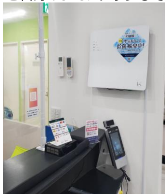
受付 (壁掛けタイプ/テーブルエアー)

— 各ブースに1台ずつ設置しています(通常はカーテンの仕切り有)壁に掛ける事で場所を取らず、感染対策中のシールも貼っているので、患者様が写真を撮って、ご自身のSNSにアップして下さったんです。"設置して良かったなあ"と実感しました。